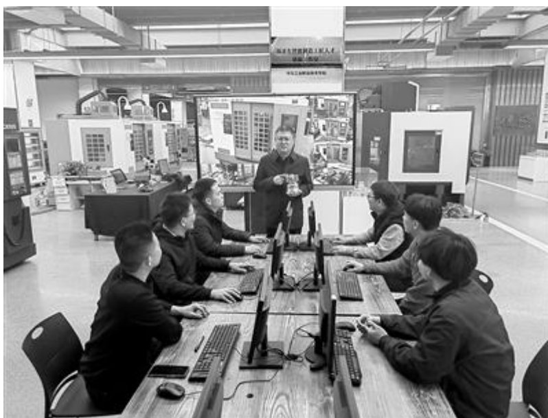
河北工业职业技术大学学生在实训基地上理实一体课程。（资料图片）