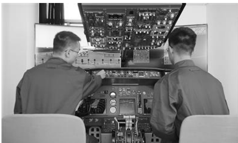
南京工业职业技术大学学生在进行飞机仪表检测与维修虚拟仿真实训。冯娴婷 摄

发展本科层次职业教育是完善现代职业教育体系的关键一环，也是适应产业转型升级的客观要求。教育部通过试点、独立学院合并转设等方式，已分批建设了 32 所职业本科学校和 3 所开办职业教育本科专业的普通高校。教育部职业教育发展中心于 2021 年 11 月组织开展了全国职业本科院校学情问卷调查，重点关注学生学习投入、学习感受、学习反馈及学校育人环境等情况。