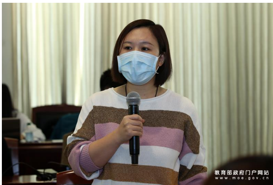
总台央视记者提问。