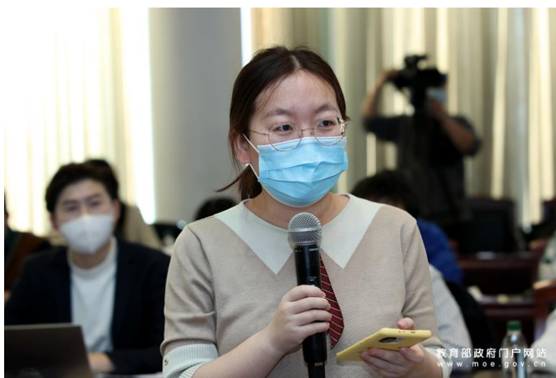
人民日报记者提问。