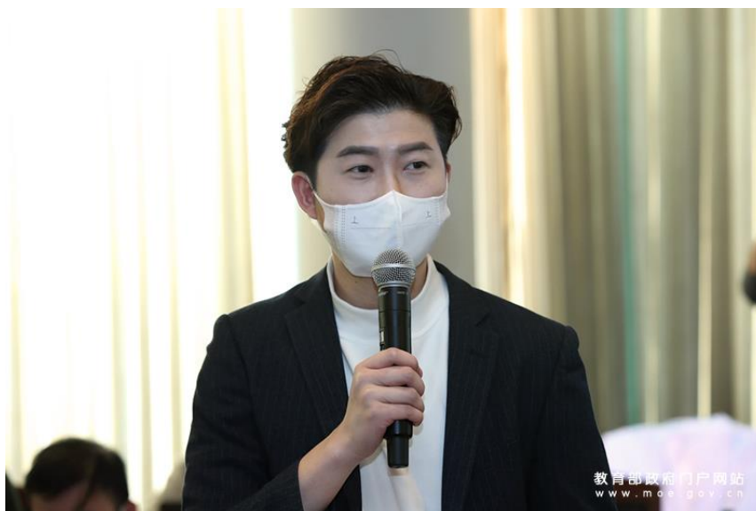
封面新闻记者提问。

下一步，我们要继续打造好高水平职业学校，深化产教融合、校企合作，做实做优做强职业教育基础。另外，我们还要继续完善“职教高考”制度。综合施策、多管齐下，切实把中等职业教育办得越来越好，吸引更多优秀学子走技能成才、技能报国之路。