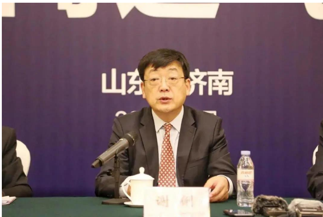
2021年职业教育活动周情况介绍

大家上午好！感谢大家一直以来对职业教育的关心、支持和大力宣传。下面，由我来向大家通报一下2021年职业教育活动周的相关情况。