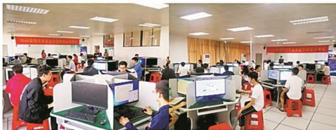
东莞职业技术学院计算机工程系开展1+X证书制度试点

今年，广东省在扩招政策上继续严格落实“质量型扩招”要求，省内各高职院校也在提升办学水平、建设教师队伍、创新人才培养等方面作出响应，为高职高质量扩招护航。