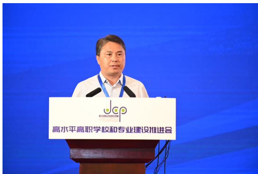
服务乡村振兴战略，打造当地离不开的“双高”样板 ——江苏农林职业技术学院校长 简祖平