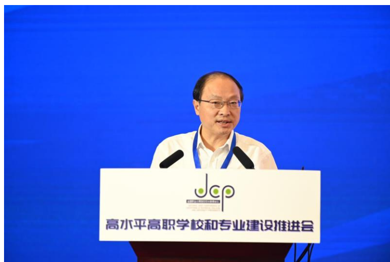
政校协同、选育用香，“双高”建设推进乡土人才培养的创新实践